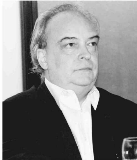
El escriptor barcelonés Enrique Vila-Matas.

Enrique Vila-Matas se'ns presenta com un estrany, un observador insòlit de la realitat, que ens parla de l'etern conflicte entre el pare i el fill, dues branques del mateix arbre les arrels es troba en la il·lusió de veure la realitat com una fira de les vanitats.