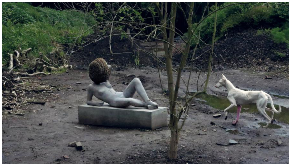
Pierre Huyghe, Untitled , 2012, Documenta 13

fora – può avere un valore funzionale di per sé, ma che se si sposta lo sguardo dall'insieme diventa esso stesso motore generante, perché in grado di rispondere all'anelito dell'essere umano di cercare quello che ancora non si vede. Questo nucleo della riflessione sull'arte diventa nel romanzo epicentro narrativo, perché mentre accompagniamo lo scrittore nelle sue passeggiate speculative, che lo fanno perdere a Kassel e dentro le installazioni, assistiamo alla genesi delle sue risposte che prendono forma dai movimenti ecfrastici con cui narra le opere d'arte: nello stesso tempo si impegna a creare un suo doppio che meglio sa accomodarsi nei panni del finto scrittore da interpretare al ristorante cinese. Il romanzo dunque non si limita a raccontare un viaggio e a 'mostrare' delle opere che accadono, ma lascia anche intravedere le ironiche e malinconiche pieghe autobiografiche dell'uomo e ci conduce all'interno del personale laboratorio dello scrittore; crea personaggi reali con cui dibattere ( in primis gli stessi organizzatori di Documenta 13) e si arrende alla presenza di un doppio in grado di non smarrirsi dentro la magniloquenza dell'arte contemporanea.